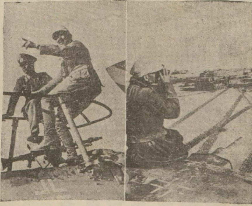
Şimali Afrikada bir Alman motörlü kolu ve komutanı

Londra 6 (A.A.) — Mısır'daki harb cephesini gezmiş olan gazetecilerin muhabetleri müttefiklere takviye kuvvetleri geldiğini görmüşlerdir.