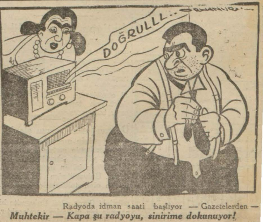
Radyoda idman saati başlıyor — Gazetelerden — Muhtekir — Kapa şu radyoyu, sinirime dokunuyor!

Düncü yelken yarışlarından güzel bir görünüş. Su sporları ajanlığının tertib ettiği birinci teşvik yelken yarışları dün Moda koyunda büyük bir müskülât ve tabiatle yapılan çetin bir mücadele içinde icra edildi. Bütün gün esen kuvvetli bir poyraz denizi âdeta dağlara çıkaracak kadar kabarmış ve bu yüzden yarışa iştirak eden bütün yelkençiler deniz hayatlarının en güç bir gününü yaşamışlardır.